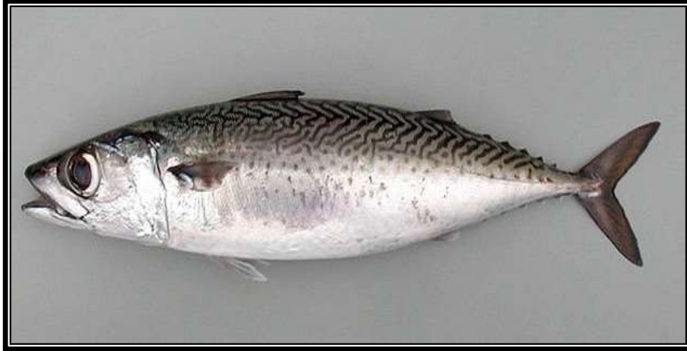
شكل (1) سمك الكوالي (mackerel) ( Scomber japonicus ).

الشهريّة في محتوى الدهن الكلي، الدهون المتعادلة والدهون الفوسفورية وذلك في عينات سمك الكوالي ( Scomber japonicus ) المصادة محليا وهي موضحة بالشكل (1). ثانياً التقدير النوعي والكمي لبعض الأحماض الدهنية المشبعة، أحادية وعديدة اللاتشبع المشبعة (الوميغا 3 و6) الداخلة في تركيب دهن سمك الكوالي الخاضع للدراسة ومدى تأثيرها بالاختلافات الشهريّة.